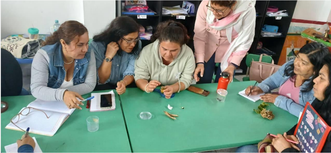
Docentes del nivel inicial participan en las sesiones presenciales del curso de estrategias didácticas del área de ciencia y tecnología de la plataforma EDUCAPACASMAYO.