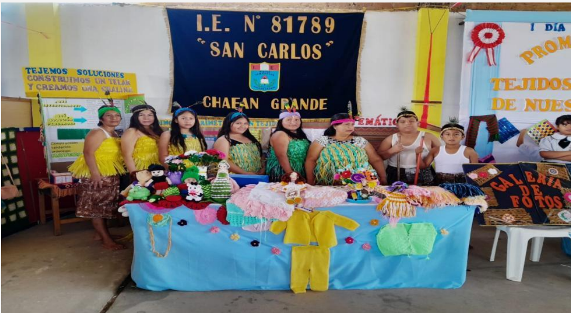
Directivos, docentes y estudiantes de las redes educativas rurales con enfoque territorial participan en el día del logro.