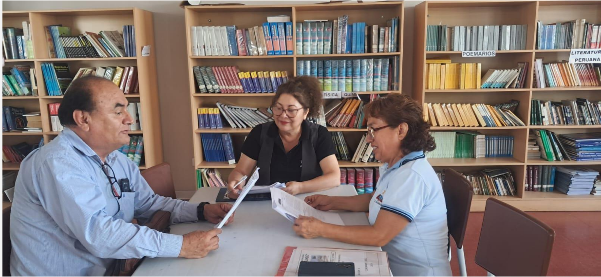
Diálogo reflexivo y retroalimentación al docente por el Director de la IE