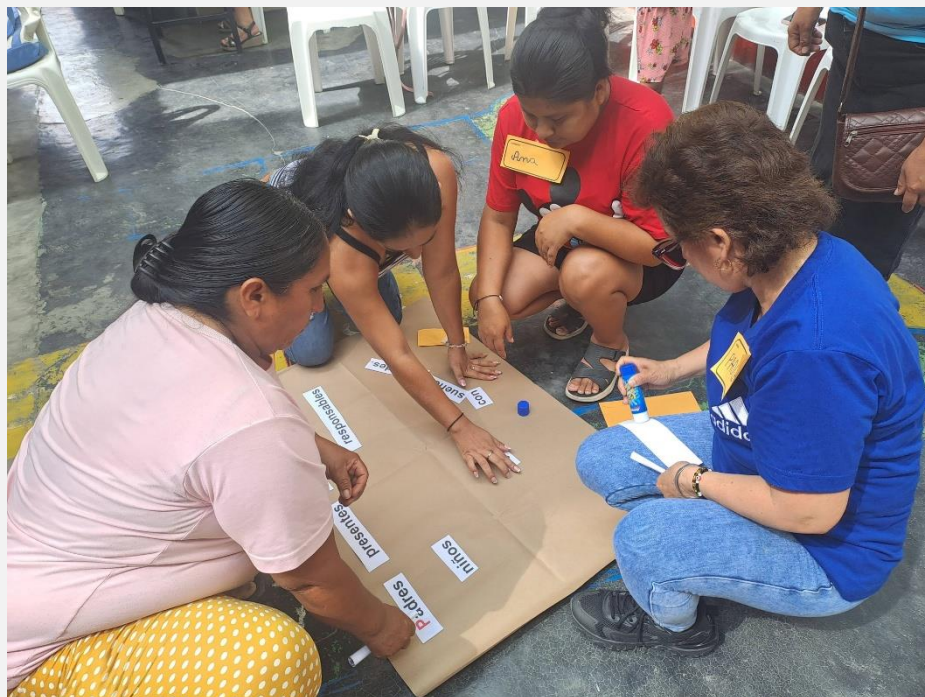
Reunión y espacios de orientación con las familias