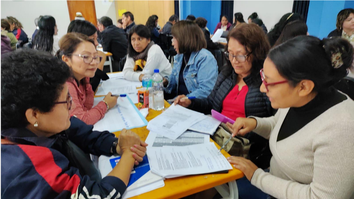
Talleres de capacitación presencial en las semanas de gestión