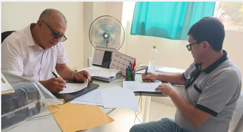
Asesoría del Especialista a la directora para la preparación del diálogo reflexivo