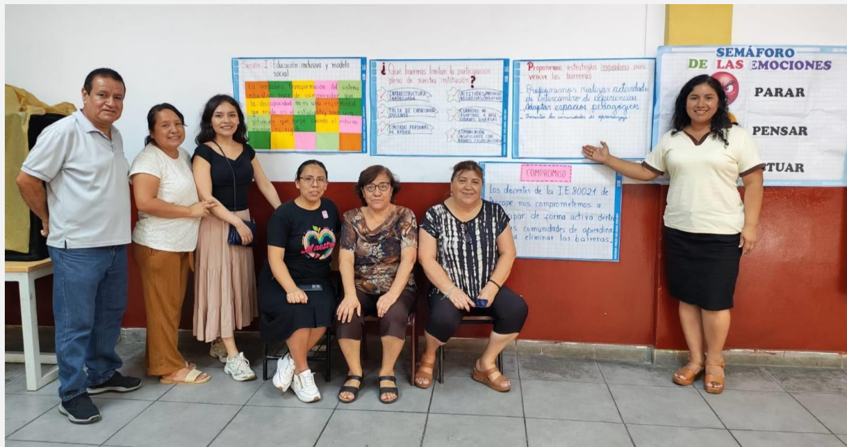
Desarrollo de comunidades profesionales de aprendizaje