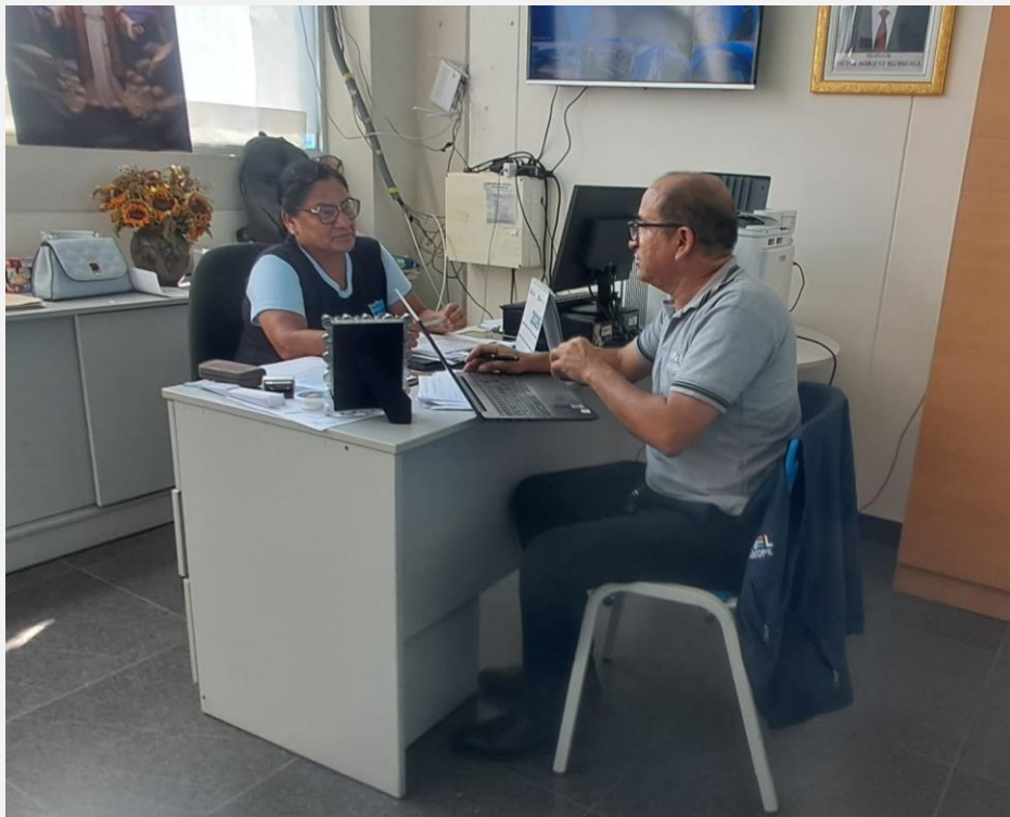
Retroalimentación al directivo por el especialista de educación