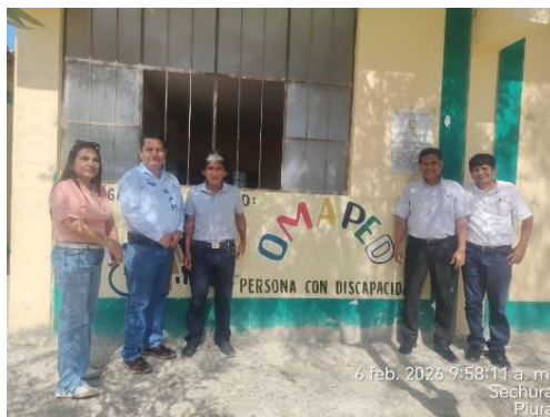
6 feb. 2026 9:58:11 a. m. Sechura Piura