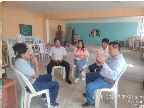
6 feb. 2026 9:39:21 a. m. Sechura Piura